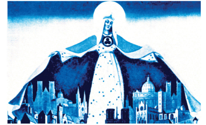
М.К.Реріх «Свята Покровителька»

В підготовці макету приймали участь Дніпропетровський театрально-художній коледж та громадська організація «День Культури Світу». Оформлення макету – Національний Центр аерокосмічної освіти молоді імені О.М. Макарова, комп'ютерна верстка – громадська організація «Педагогіка і Культура».