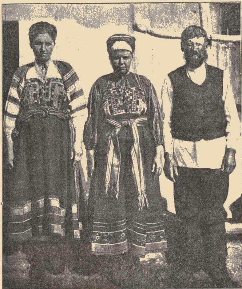
Великороссы въ своихъ костюмахъ.

рукавка“, имѣющая большое сходство съ „керсетомъ“, только дѣлается гораздо длиннѣе послѣдняго. Безрукавки носятъ, какъ дѣвушки, замужнія женщины, такъ и старухи, съ тою лишь разницею, что дѣвичья безрукавка шьется изъ одноцвѣтныхъ яркихъ матерій—красной, голубой или зеленой и со множествомъ различныхъ обшивокъ изъ тесьмы и шнурковъ съ блестящими пуговицами. Женская безрукавка дѣлается уже изъ болѣе скромныхъ ситцевыхъ матерій съ несложными украшениями. Старухи носятъ безрукавки изъ синей